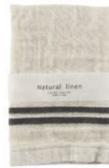
RE5141 ※ ナチュラルリネン ハンドタオル グレー 450円 (税込495円) サイズ/約w330 × h380mm 素材/リネン25% 綿75% 日本製 [出荷単位 5]