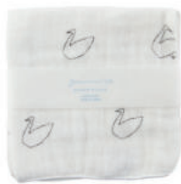
L2060 ★やわらかガーゼハンカチ 白鳥 350円 (税込385円) サイズ/約w260 × h260mm 素材/綿100% 日本製 【出荷単位 5】