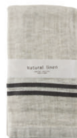
RE5143 ※ ナチュラルリネン フェイスタオル グレー 850円 (税込935円) サイズ/約w330 × h900mm 素材/リネン25% 綿75% 日本製 [出荷単位 3]