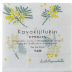
RE5148 ※ かや生地ふきん ミモザ 450円 (税込495円) サイズ/約w300 × h300mm 素材/表面:綿100%、中裏面:レーヨン100% 日本製 【出荷単位 5】