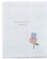
RE5174 ※かや生地ふきん 刺繍 フラワーピンク 500円 (税込550円) サイズ/約w300 × h300mm 素材/レーヨン100% 日本製 [出荷単位 5]