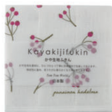
RE5149 ※ かや生地ふきん ローズヒップ 450円 (税込495円) サイズ/約w300 × h300mm 素材/表面:綿100%、中裏面:レーヨン100% 日本製 【出荷単位 5】