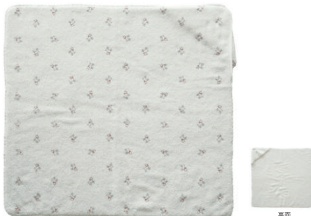
TE879 ★ふんわりフードタオル 白ヤギ 4,500円 (税込4,950円) サイズ/約w750 × h750mm 素材/綿100% 日本製

愛らしいヤギ柄とやわらかな肌触りが特徴のふんわりタオルシリーズです。 吸水性や通気性の高いコットン100%の無撚糸を使用しているため 赤ちゃんのお肌にも優しく、出産祝いなどのギフトにぴったりのアイテムです。