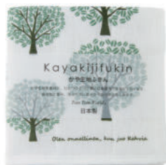
RE5146 ※ かや生地ふきん コーヒーの木 グリーン 450円 (税込495円) サイズ/約w300 × h300mm 素材/表面:綿100%、中裏面:レーヨン100% 日本製 【出荷単位 5】