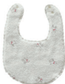
TE880 ★ふんわりスタイ 白ヤギ 1,500円 (税込1,650円) サイズ/約w230 × h300mm 素材/綿100% 日本製