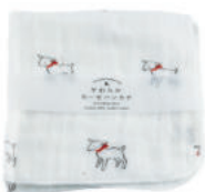
RE5127 ★やわらかガーゼハンカチ 白ヤギ 350円 (税込385円) サイズ/約w260 × h260mm 素材 / 綿100% 日本製 [出荷単位 5]

マルチタオルは、バスタオルとしてはもちろん 赤ちゃんのおくるみ、お昼寝タオルケット、 ベビーカーの日除けなどマルチに活躍するサイズです。 軽くてかさばらないので、お出かけにもぴったり。