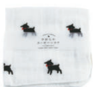
RE5128 ★やわらかガーゼハンカチ 黒ヤギ 350円 (税込385円) サイズ/約w260 × h260mm 素材 / 綿100% 日本製 [出荷単位 5]