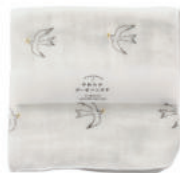
TE737 ★やわらかガーゼハンカチ トリ 350円 (税込385円) サイズ/約w260 × h260mm 素材 / 綿100% 日本製 [出荷単位 5]