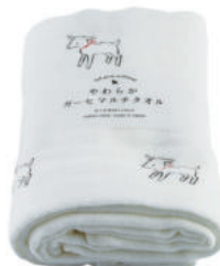
RE5131 ★やわらかガーゼマルチタオル 白ヤギ 1,800円 (税込1,980円) サイズ/約w680 × h1100mm 素材 / 綿100% 日本製 [出荷単位 2]