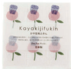
RE5138 ※ かや生地ふきん フラワー ピンク 450円 (税込495円) サイズ/約w300 × h300mm 素材/表面:綿100%、中裏面:レーヨン100% 日本製 【出荷単位 5】

ひとつひとつ丁寧に日本国内でつくっています。 吸収性に富み、洗うたびに柔らかくなります。