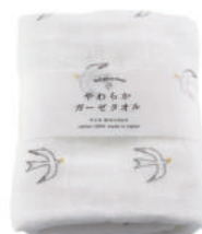
TE738 ★やわらかガーゼタオル トリ 700円 (税込770円) サイズ/約w340 × h850mm 素材 / 綿100% 日本製 [出荷単位 3]