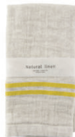
RE5142 ※ ナチュラルリネン フェイスタオル イエロー 850円 (税込935円) サイズ/約w330 × h900mm 素材/リネン25% 綿75% 日本製 [出荷単位 3]