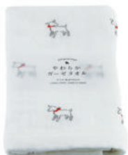
RE5129 ★やわらかガーゼタオル 白ヤギ 700円 (税込770円) サイズ/約w340 × h850mm 素材 / 綿100% 日本製 [出荷単位 3]