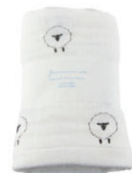
L2065 ★やわらかガーゼマルチタオル 羊 1,800円 (税込1,980円) サイズ/約w680 × h1100mm 素材/綿100% 日本製 【出荷単位 2】