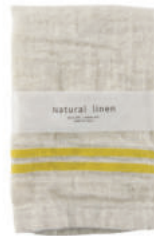
RE5140 ※ ナチュラルリネン ハンドタオル イエロー 450円 (税込495円) サイズ/約w330 × h380mm 素材/リネン25% 綿75% 日本製 [出荷単位 5]