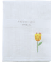
RE5175 ※かや生地ふきん 刺繍 フラワーイエロー 500円 (税込550円) サイズ/約w300 × h300mm 素材/レーヨン100% 日本製 [出荷単位 5]