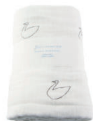
L2062 ★やわらかガーゼマルチタオル 白鳥 1,800円 (税込1,980円) サイズ/約w680 × h1100mm 素材/綿100% 日本製 【出荷単位 2】