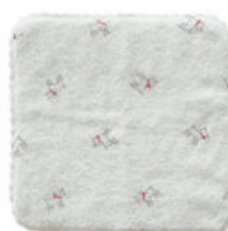
TE881 ★ふんわりハンカチ 白ヤギ 600円 (税込660円) サイズ/約w240 × h240mm 素材/綿100% 日本製