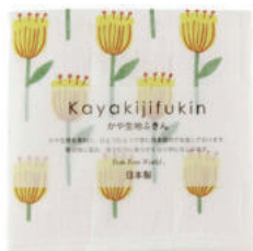
RE5139 ※ かや生地ふきん フラワー イエロー 450円 (税込495円) サイズ/約w300 × h300mm 素材/表面:綿100%、中裏面:レーヨン100% 日本製 【出荷単位 5】