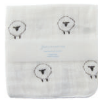
L2063 ★やわらかガーゼハンカチ 羊 350円 (税込385円) サイズ/約w260 × h260mm 素材/綿100% 日本製 【出荷単位 5】