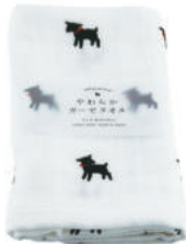
RE5130 ★やわらかガーゼタオル 黒ヤギ 700円 (税込770円) サイズ/約w340 × h850mm 素材 / 綿100% 日本製 [出荷単位 3]