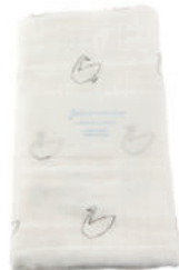
L2061 ★やわらかガーゼタオル 白鳥 700円 (税込770円) サイズ/約w340 × h850mm 素材/綿100% 日本製 【出荷単位 3】