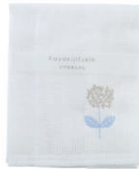
RE5176 ※かや生地ふきん 刺繍 フラワーブルー 500円 (税込550円) サイズ/約w300 × h300mm 素材/レーヨン100% 日本製 [出荷単位 5]