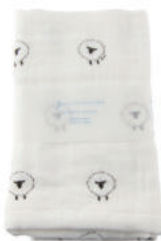
L2064 ★やわらかガーゼタオル 羊 700円 (税込770円) サイズ/約w340 × h850mm 素材/綿100% 日本製 【出荷単位 3】