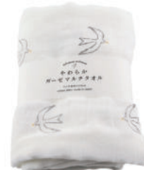
TE739 ★やわらかガーゼマルチタオル トリ 1,800円 (税込1,980円) サイズ/約w680 × h1100mm 素材 / 綿100% 日本製 [出荷単位 2]