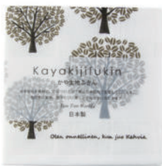
RE5147 ※ かや生地ふきん コーヒーの木 ブラウン 450円 (税込495円) サイズ/約w300 × h300mm 素材/表面:綿100%、中裏面:レーヨン100% 日本製 【出荷単位 5】