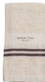
RE5143 ※ ナチュラルリネン フェイスタオル グレー 900円 (税込990円) サイズ/約w330 × h900mm 素材/リネン25% 綿75% 日本製 [出荷単位 3]