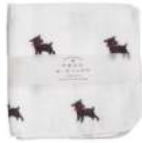
RE5128 ★やわらかガーゼハンカチ 黒ヤギ 380円 (税込418円) サイズ/約w260 × h260mm 素材 / 綿100% 日本製 [出荷単位 5]