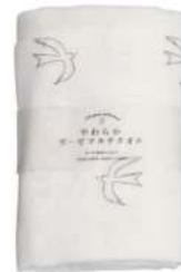
TE739 ★やわらかガーゼマルチタオル トリ 2,000円 (税込2,200円) サイズ/約w680 × h1100mm 素材 / 綿100% 日本製 [出荷単位 2]