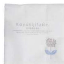
RE5176 ※かや生地ふきん 刺繍 フラワーブルー 550円 (税込605円) サイズ/約w300 × h300mm 素材/レーヨン100% 日本製 [出荷単位 5]