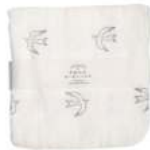
TE737 ★やわらかガーゼハンカチ トリ 380円 (税込418円) サイズ/約w260 × h260mm 素材 / 綿100% 日本製 [出荷単位 5]