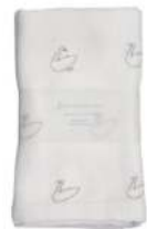
L2061 ★やわらかガーゼタオル 白鳥 750円 (税込825円) サイズ/約w340 × h850mm 素材 / 綿100% 日本製 [出荷単位 3]