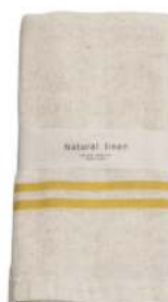
RE5142 ※ ナチュラルリネン フェイスタオル イエロー 900円 (税込990円) サイズ/約w330 × h900mm 素材/リネン25% 綿75% 日本製 [出荷単位 3]