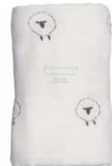
L2065 ★やわらかガーゼマルチタオル 羊 2,000円 (税込2,200円) サイズ/約w680 × h1100mm 素材 / 綿100% 日本製 [出荷単位 2]