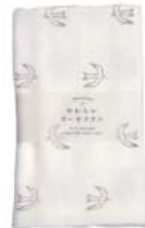
TE738 ★やわらかガーゼタオル トリ 750円 (税込825円) サイズ/約w340 × h850mm 素材 / 綿100% 日本製 [出荷単位 3]