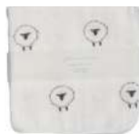
L2063 ★やわらかガーゼハンカチ 羊 380円 (税込418円) サイズ/約w260 × h260mm 素材 / 綿100% 日本製 [出荷単位 5]