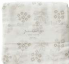
L2027 ガーゼ大判ふきん ワスレナグサ グレー 700円 (税込770円) サイズ/約w440 × h440mm 素材/綿100% 日本製 [出荷単位 3]