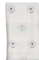
L2064 ★やわらかガーゼタオル 羊 750円 (税込825円) サイズ/約w340 × h850mm 素材 / 綿100% 日本製 [出荷単位 3]