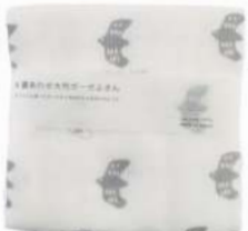
RE5173 ※ガーゼ大判ふきん カモメ グレー 500円 (税込550円) サイズ/約w440 × h440mm 素材/綿100% 日本製 [出荷単位 5]