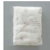
個包装パッケージ入り