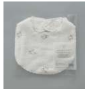
個包装パッケージ入り

TE880 ★ふんわりスタイ 白ヤギ 1,800円 (税込1,980円) サイズ/約w230 × h300mm 素材/綿100% 日本製