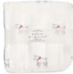
RE5127 ★やわらかガーゼハンカチ 白ヤギ 380円 (税込418円) サイズ/約w260 × h260mm 素材 / 綿100% 日本製 [出荷単位 5]

マルチタオルは 薄手のバスタオルとしてはもちろん 赤ちゃんのおくるみ、お昼寝タオルケット、 ベビーカーの日除けなど マルチに活躍するサイズです。 軽くてかさばらないので、 お出かけにもぴったり。