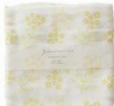
L2028 ガーゼ大判ふきん ワスレナグサ イエロー 700円 (税込770円) サイズ/約w440 × h440mm 素材/綿100% 日本製 [出荷単位 3]