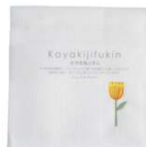
RE5175 ※かや生地ふきん 刺繍 フラワーイエロー 550円 (税込605円) サイズ/約w300 × h300mm 素材/レーヨン100% 日本製 [出荷単位 5]