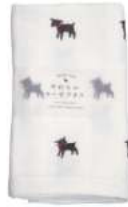
RE5130 ★やわらかガーゼタオル 黒ヤギ 750円 (税込825円) サイズ/約w340 × h850mm 素材 / 綿100% 日本製 [出荷単位 3]

マルチタオルは 薄手のバスタオルとしてはもちろん 赤ちゃんのおくるみ、お昼寝タオルケット、 ベビーカーの日除けなど マルチに活躍するサイズです。 軽くてかさばらないので、 お出かけにもぴったり。