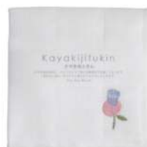
RE5174 ※かや生地ふきん 刺繍 フラワーピンク 550円 (税込605円) サイズ/約w300 × h300mm 素材/レーヨン100% 日本製 [出荷単位 5]