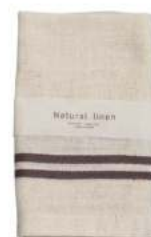
RE5141 ※ ナチュラルリネン ハンドタオル グレー 480円 (税込528円) サイズ/約w330 × h380mm 素材/リネン25% 綿75% 日本製 [出荷単位 5]