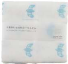
RE5172 ※ガーゼ大判ふきん カモメ ブルー 500円 (税込550円) サイズ/約w440 × h440mm 素材/綿100% 日本製 [出荷単位 5]

ざっくりと織ったガーゼを6枚あわせた大判サイズのふきんです。 タオルハンカチのように使ったり、お弁当包みとしても使っても。