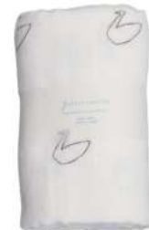
L2062 ★やわらかガーゼマルチタオル 白鳥 2,000円 (税込2,200円) サイズ/約w680 × h1100mm 素材 / 綿100% 日本製 [出荷単位 2]