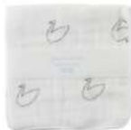
L2060 ★やわらかガーゼハンカチ 白鳥 380円 (税込418円) サイズ/約w260 × h260mm 素材 / 綿100% 日本製 [出荷単位 5]