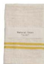
RE5140 ※ ナチュラルリネン ハンドタオル イエロー 480円 (税込528円) サイズ/約w330 × h380mm 素材/リネン25% 綿75% 日本製 [出荷単位 5]