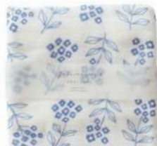
L2029 ガーゼ大判ふきん ワスレナグサ ブルー 700円 (税込770円) サイズ/約w440 × h440mm 素材/綿100% 日本製 [出荷単位 3]