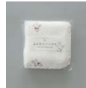
個包装パッケージ入り

TE881 ★ふんわりハンカチ 白ヤギ 700円 (税込770円) サイズ/約w240 × h240mm 素材/綿100% 日本製