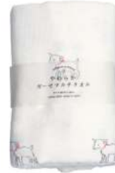
RE5131 ★やわらかガーゼマルチタオル 白ヤギ 2,000円 (税込2,200円) サイズ/約w680 × h1100mm 素材 / 綿100% 日本製 [出荷単位 2]