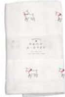
RE5129 ★やわらかガーゼタオル 白ヤギ 750円 (税込825円) サイズ/約w340 × h850mm 素材 / 綿100% 日本製 [出荷単位 3]