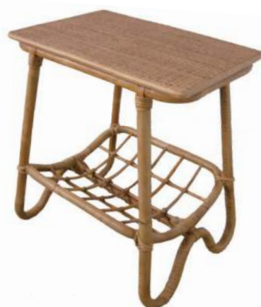
TE729 ★ラタンスクエアテーブル 15,800円 (税込17,380円) サイズ/約w450 × d350 × h495mm 素材/藤

※天然素材のラタンを使用しているため、色むらやけぼたちなど個体差がある可能性があります。