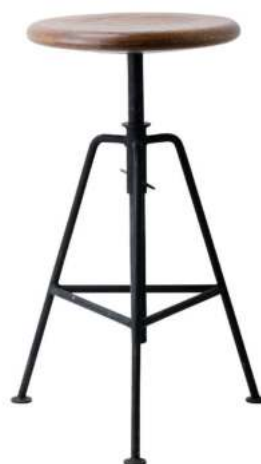
CL002S スツールアジャスター 18,800円 (税込20,680円) サイズ/約w285 × d285 × h470~700mm ※45mm間隔で7段階に高さ調節可能 座面サイズ/約直径270mm 素材/レッドオーク材、鉄