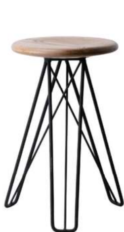
CL001S スツール 15,800円 (税込17,380円) サイズ/約w285 × d285 × h460mm 座面サイズ/約直径270mm 素材/レッドオーク材、鉄