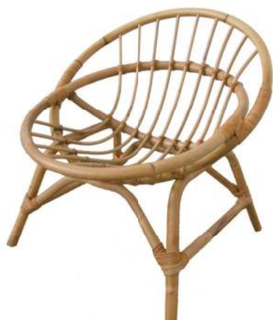
TE728 ★ラタンラウンドチェア 18,000円 (税込19,800円) サイズ/約w570 × d575 × h570mm 座面h300mm 素材/藤