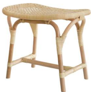
HS3220 ★tuttu ラタン四角スツール 16,800円 (税込18,480円) サイズ/約w480 × d300 × h420mm 素材/藤