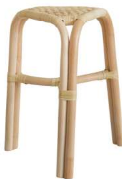
HS3221 ★tuttu ラタン三角スツール 13,800円 (税込15,180円) サイズ/約w360 × d320 × h450mm 素材/藤