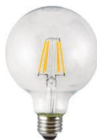
HS2892 LEDボール型電球E26 3,500円 (税込3,850円)

サイズ/約直径95 × h135mm 口金径/E26 消費電力/6.9W 重量/約56g 定格寿命/約20,000時間 全光束/810ルーメン 色温度/2700K ※60W相当 ※密閉対応可