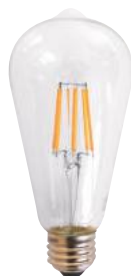
HS3081 エジソン型LED電球E26 3,200円 (税込3,520円)

サイズ/約直径64 × h140mm 口金径/E26 消費電力/7W 重量/約45g 定格寿命/約20,000時間 全光束/810ルーメン 色温度/2700K ※60W相当 ※密閉対応可