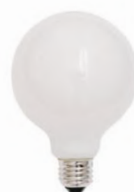
HS3310 ボール型LED電球E26乳白 100W相当 3,500円 (税込3,850円)

サイズ/約直径95 × h135mm 口金径/E26 消費電力/10W 重量/約59g 定格寿命/約20,000時間 全光束/1520ルーメン 色温度/3000K ※100W相当 ※密閉対応可